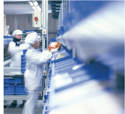
Produktion Bedford Fleischwaren

Bei der Produktion von handwerklich hochwertigen Wurst- und Schinkenspezialitäten ist Bedford Fleischwaren GmbH + Co. KG, Osnabrück, auf hochwertigen Flüssigstickstoff angewiesen. 400.000 Kubikmeter BIOGON® verbraucht das Unternehmen im Jahr. Die Beschaffung bedeutet einen hohen logistischen Aufwand, zumal bei Bedford besondere Bedingungen — z.B. Produktionsschwankungen — herrschen. Ein innovatives Gasemanagement mit der Tankstandsfernüberwachung und automatischen Gaseversorgung SECCURA® Bulk Management von Linde Gas unterstützt die Logistik wirkungsvoll: Das System erfasst automatisch Verbrauchsdaten und Tankfüllstände und überträgt die Daten direkt an die Disposition. Damit ist sichergestellt, dass alle Gase ständig verfügbar sind und mit optimierter Logistik geliefert werden.