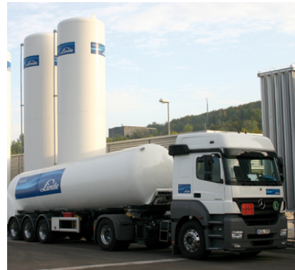
Tankwagen von Linde Gas