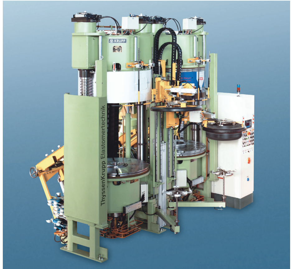
Stickstoffbetriebene Reifenpresse